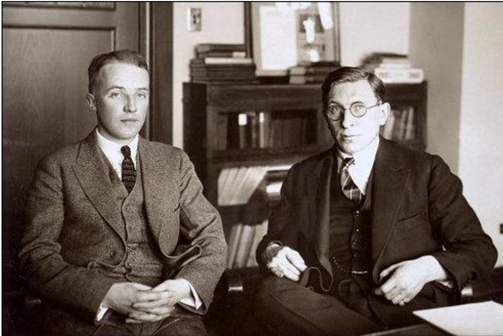
100 jaar geleden in 1921 ontdekte dr. Frederick Banting (r) en Charles Best (l) uit Canada insuline