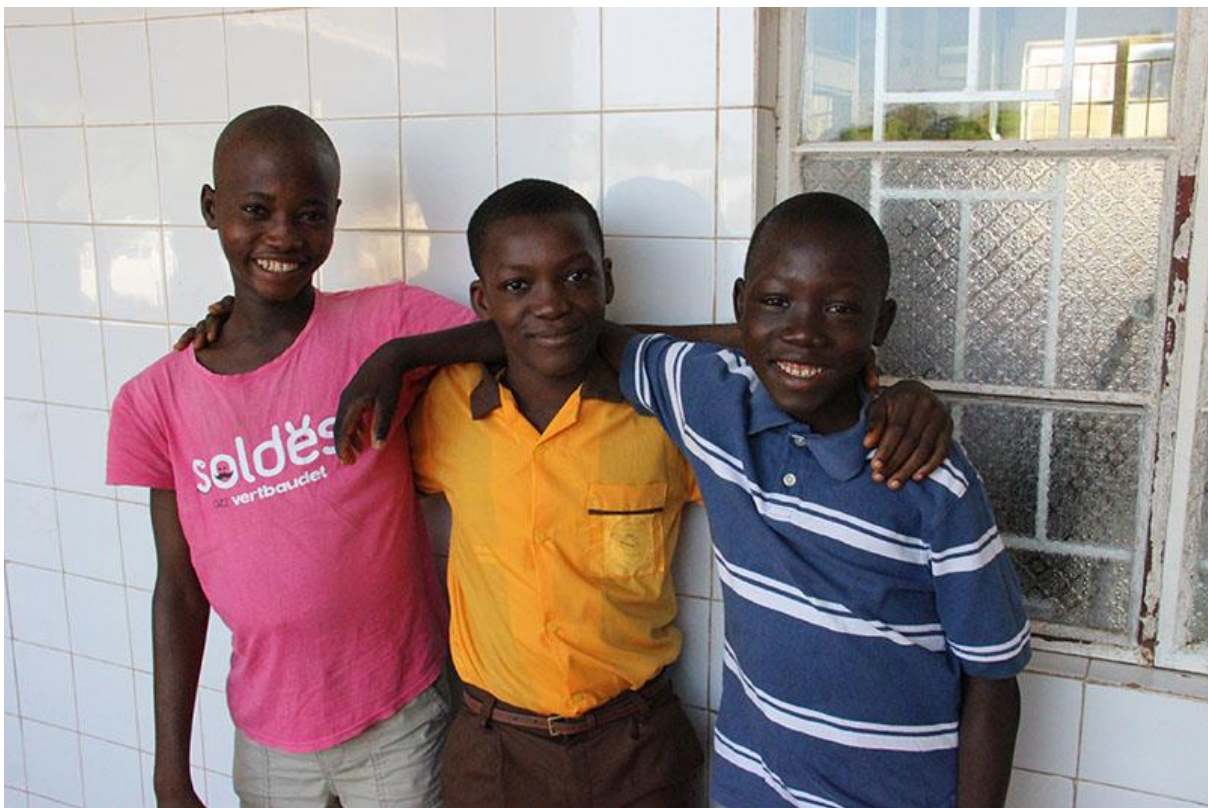
Jongeren met type 1 diabetes in Makeni, Sierra Leone, die insuline en hulpmiddelen ontvangen van Insulin for Life Nederland.